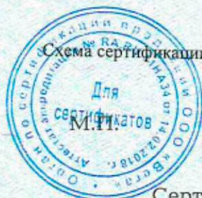
Схема сертификации: За