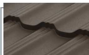
RAL 8019 MATT тёмно-коричневый матовый