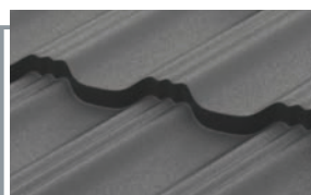
RAL 7024 MATT тёмно-серый матовый