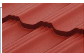
RAL 3009 MATT тёмно-терракотовый матовый