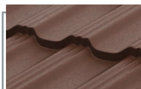
RAL 8017 MATT коричневый матовый