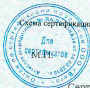
Схема сертификации: За